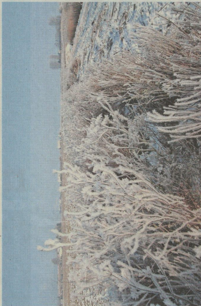
Akkerranden die niet bewerkt worden en geschikt zijn om in te zaaien met zaden, bloemen en grassen, een geschikte biotoop voor patrijzen en andere akkervogels, ook in de winter.

delen zoals imidacloprid wordt uitgebannen, valt veel winst te behalen voor bijen, insecten en indirect voor de akkervogels. Veel boeren in de Hoeksche Waard zijn zich in toenemende mate bewust van hun verantwoordelijkheid voor behoud van natuur en biodiversiteit. Ook de boeren van H-Wodka. Deze Stichting Hoeksche Waard op de Kaart, opgericht in 2005, is een initiatief van innovatieve Hoeksche-waardse akkerbouwers. De stichting stelt zich ten doel om d.m.v. innovatie de vitaliteit van de grondgebonden landbouw te verbeteren en behoud c.q. ontplooiing van natuur en landschappelijke waarden. Via geo-akker-optimalisatie wordt een optimale indeling gemaakt van een perceel in een cultuur- en natuurakker. De stukjes natuur mogen geen eilandjes worden in agrarisch gebied maar een groen en blauw netwerk van kreken, sloten, hoekjes en stroken voor de natuur. Op die manier ontstaat een win-win situatie. Ook Stichting Rietgors gaat voor een gezonde landbouw, een aantrekkelijk landschap met natuur en recreatieve mogelijkheden. De akkerranden zijn daar een voorbeeld van. Hoewel deze 3 meter brede stroken wat smal zijn om een sub-