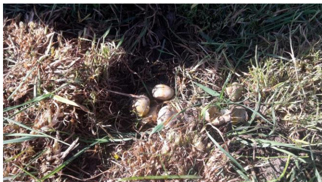
Kapot gemaaid nest

Insecten vormen een belangrijk deel van het voedsel van boerenlandvogels. Het agrarisch natuurbeheer waarvan de akkerranden onderdeel uitmaken is gericht op deze boerenlandvogels. Daar doet u het voor en die vormen ook de rechtvaardiging van de vergoeding die u ontvangt voor het agrarisch natuurbeheer.