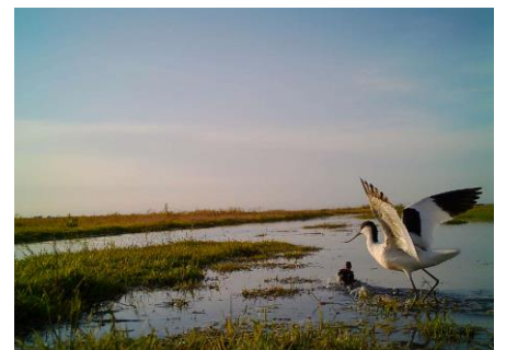
icucam4 @ RETGORS 79 °F 21 °C 20:22:11 03-06-2020