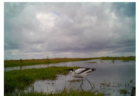
icucam4 @ RETGORS 58 °F 14 °C 10:58:34 07-06-2020