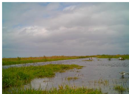
icucam4 @ RETGORS 61 °F 16 °C 13:16:07 09-06-2020

Wie heeft hier ervaring mee en is eventueel ook bereid om CCHW behulpzaam te zijn bij andere activiteiten op het gebied van communicatie? We horen graag via info@cchw.eu