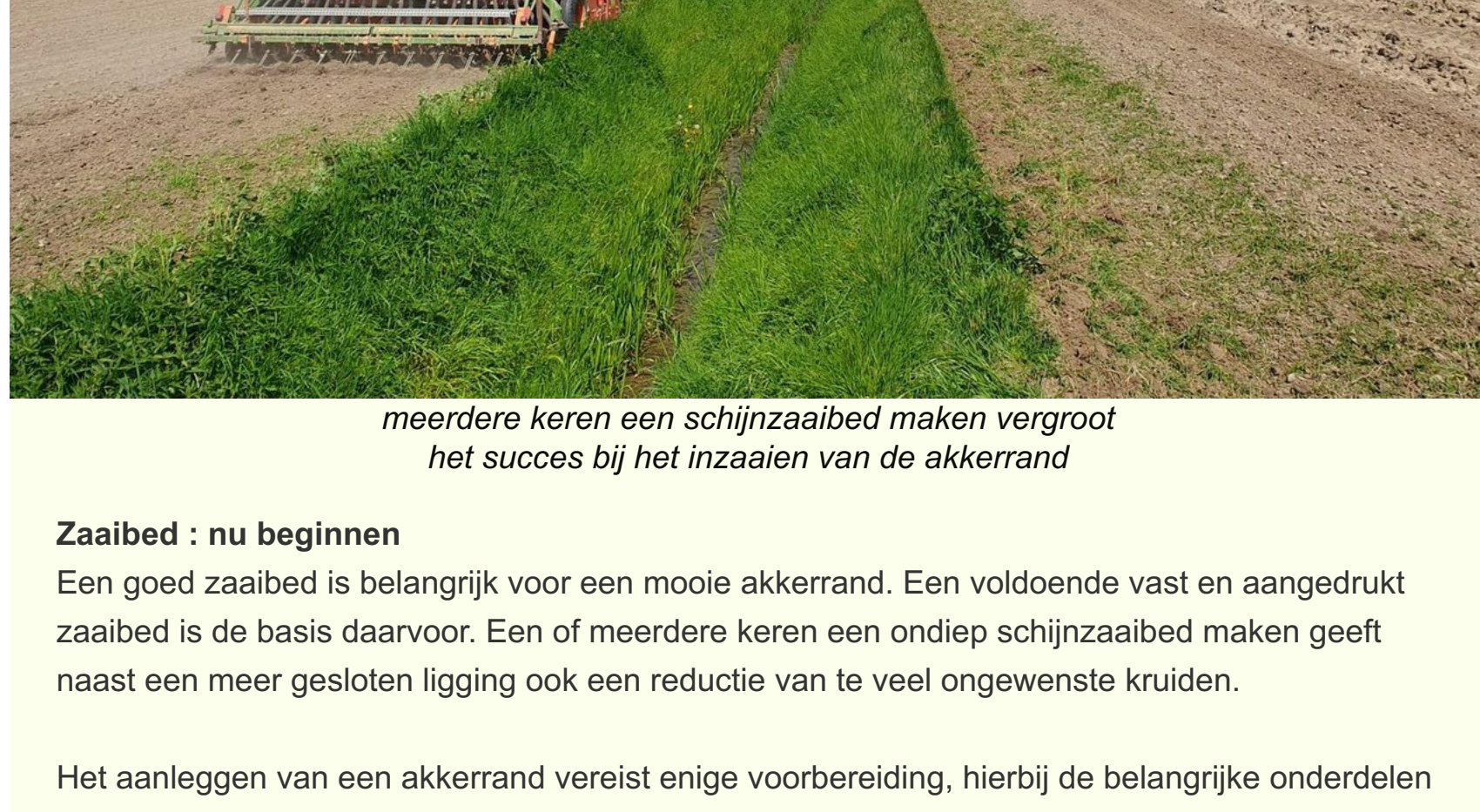
meerdere keren een schijnzaaibed maken vergroot het succes bij het inzaaien van de akkerrand